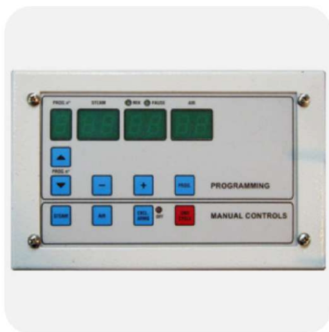
PROGRAMMATORE ELETTRONICO TREVIL