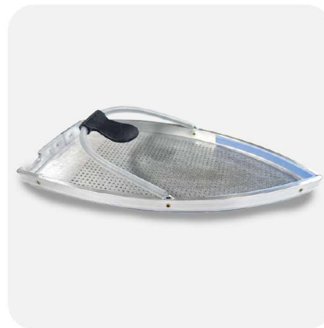
SOLETTA (OPTIONAL) PER EVITARE IL LUCIDO SUI CAPI