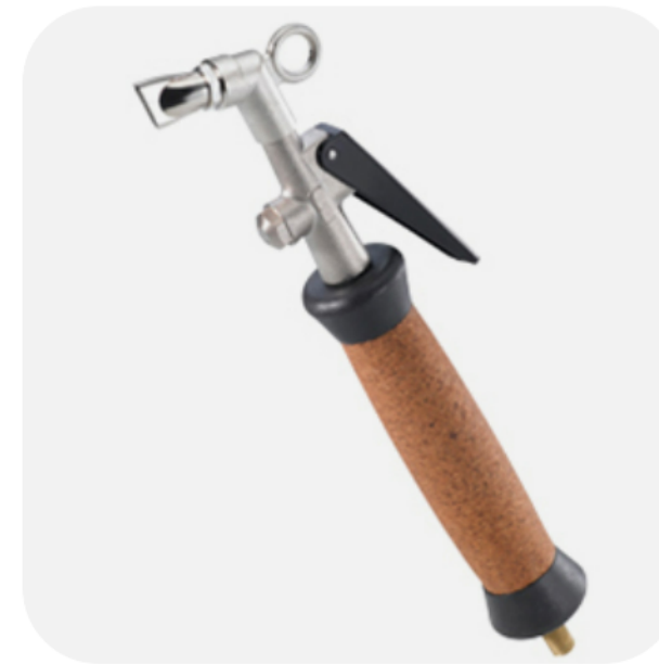
PISTOLA SECADORA DE AR COM BICO DE LÂMINA