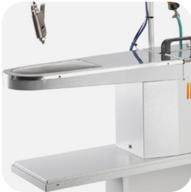
TAMPO DE AÇO INOXIDÁVEL