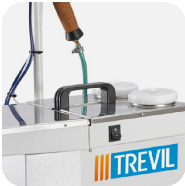
TANQUES DE PRODUTOS