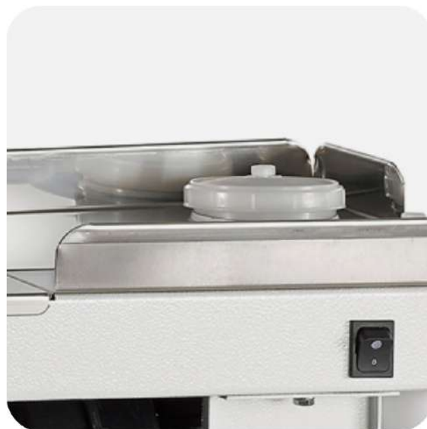
SERBATOIO PER PRODOTTO

Una pistola a trascinamento di serie, la seconda come optional.