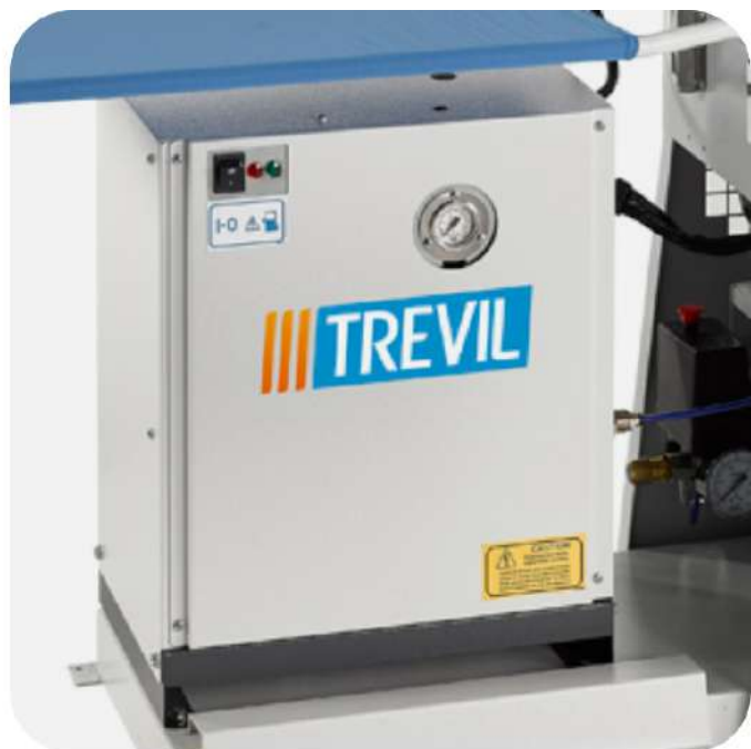
GENERATORE 4 KW CON PISTOLA ARIA/VAPORE