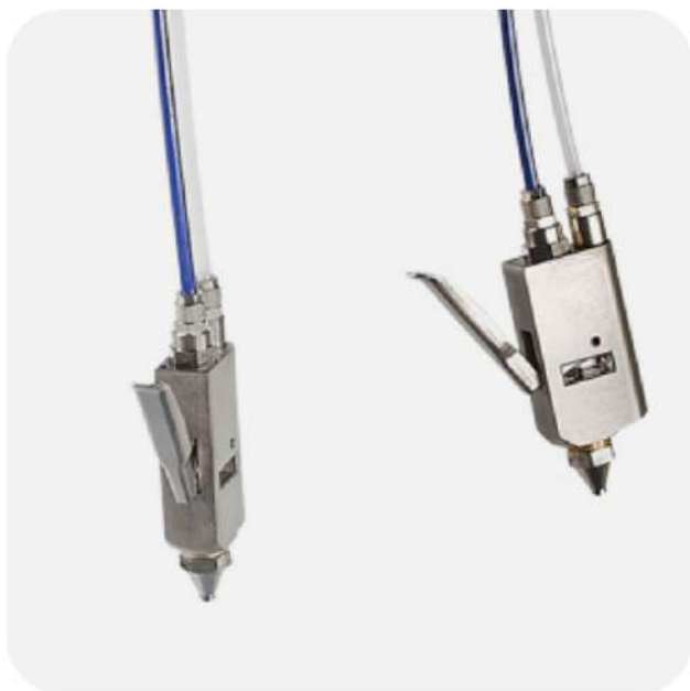
PISTOLE A TRASCINAMENTO

Una pistola a trascinamento di serie, la seconda come optional.