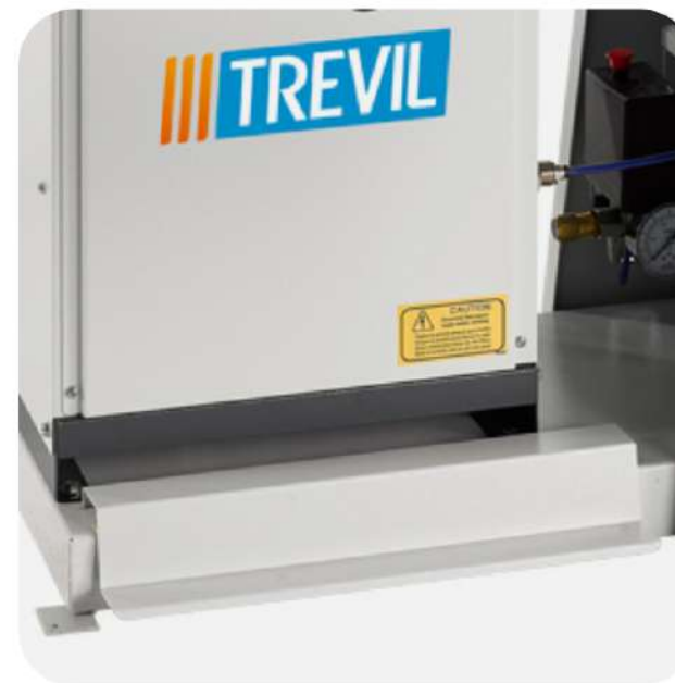
ASPIRAZIONE AZIONATA A PEDALE