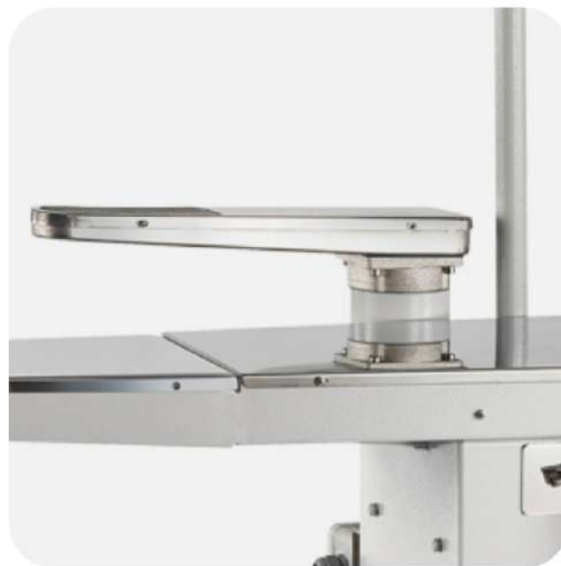
BRACCIO ASPIRANTE IN ACCIAIO INOSSIDABILE