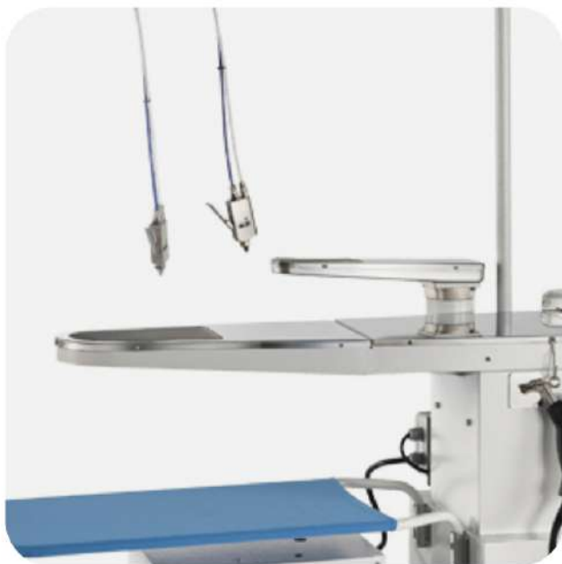
PIANO SMACCHIANTE IN ACCIAIO INOSSIDABILE