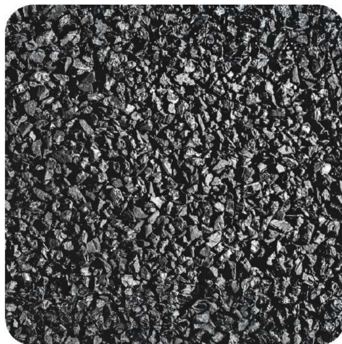
FILTRO A CARBONI ATTIVI OPZIONALI