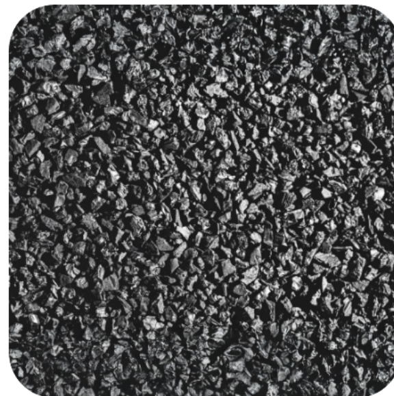
FILTRO A CARBONI ATTIVI