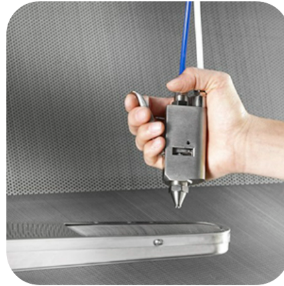
PISTOLA SMACCHIANTE A FREDDO