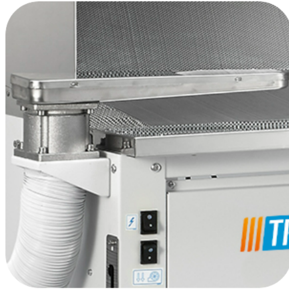
BRACCIO SMACCHIANTE ASPIRANTE ORIENTABILE