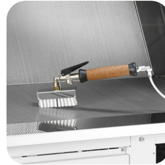
PISTOLA PER SAPONI